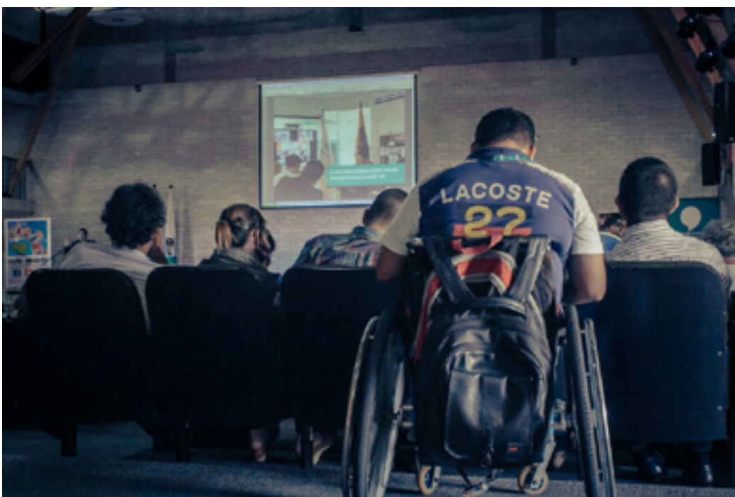
→ Simposio de discapacidad (MDE Ciudad Inteligente, 2015)

Como segunda medida, los derechos para esta población están también integrados por los denominados derechos prestacionales. Por ejemplo, la jurisprudencia ha resaltado que en situaciones de discapacidad el acceso a vías para su movilización es un derecho prestacional: “la libertad de locomoción, en su faceta prestacional, es un derecho constitucional que al igual que los demás debe ser respetado desarrollado y garantizado, máxime si es para remover los obstáculos que impiden el acceso a una persona discapacitada al sistema de transporte de su ciudad con el fin de alcanzar la igualdad real y efectiva (art. 13, CP)” (CC T-595 de 2002).