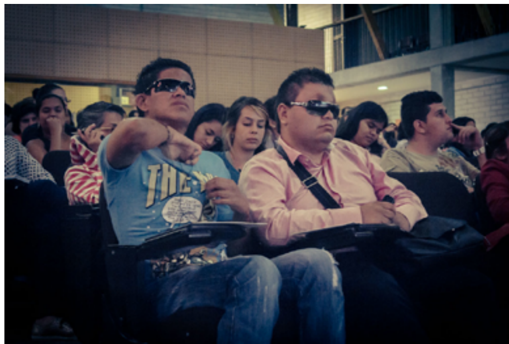
→ Simposio de discapacidad (MDE Ciudad Inteligente, 2015)

Reconocimiento de las prestaciones a la seguridad social: “Con la entrada en vigencia de la Constitución Política de 1991 en la que se incorporó la garantía de la seguridad social, se expidió la Ley 100 de 1993, en la que se prevén las diversas situaciones que pueden presentarse, así como los procedimientos que deben seguirse cuando un trabajador padece de una enfermedad o sufre una lesión que lo incapacite para laborar de manera permanente o temporal. De tal manera que dichas personas no pueden quedar desprotegidas y debe garantizarles su mínimo vital, bien sea mediante el pago de incapacidades, pago de salarios por reinstalación en el empleo o en caso de que su situación de salud sea gravosa, debe reconocerse y pagarse la pensión de invalidez respectiva, previo cumplimiento de los requisitos legales exigidos” (CCT-566 de 2011 citando las sentencias CCT-729 de 2006 y T-039 de 2010).