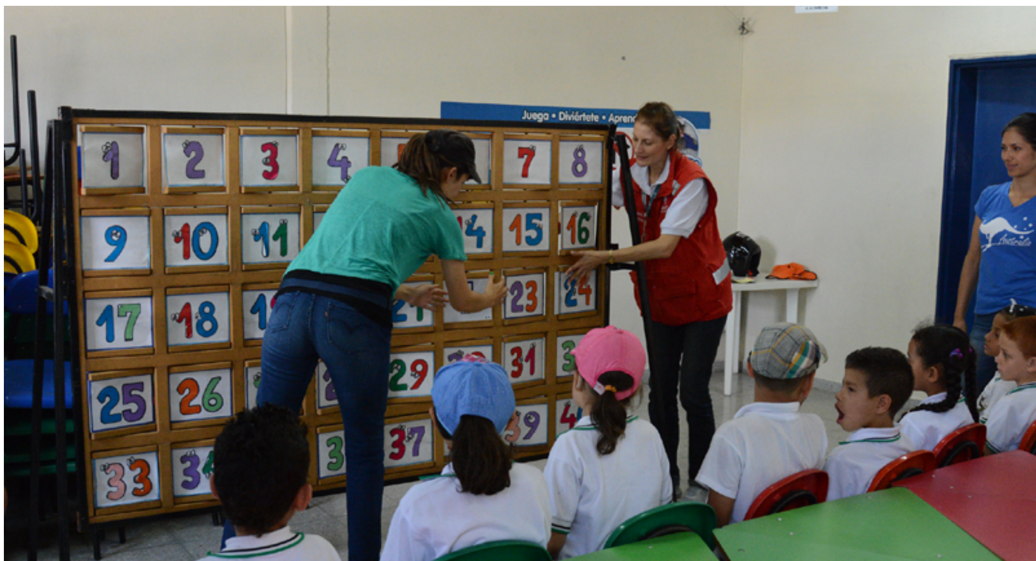
→ RECORTE DE Niños con discapacidad auditiva visitan nuestra Pista Infantil de Tránsito (Secretaría de Movilidad de Medellín, 2015)

Uno de los derechos destacables a partir de la protección social es la pensión de invalidez. Este derecho “adquiere el carácter de fundamental dada la condición de vulnerabilidad o debilidad manifiesta del afectado y la íntima relación que puede establecerse entre el derecho prestacional y las condiciones materiales de subsistencia del ciudadano. Esta consideración se desprende, además, de las obligaciones constitucionales de tomar medidas