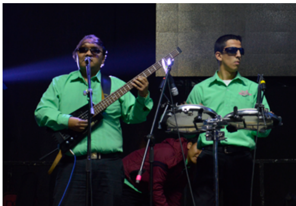
→ Día Internacional de la Discapacidad (Participación Bogotá, 2016)