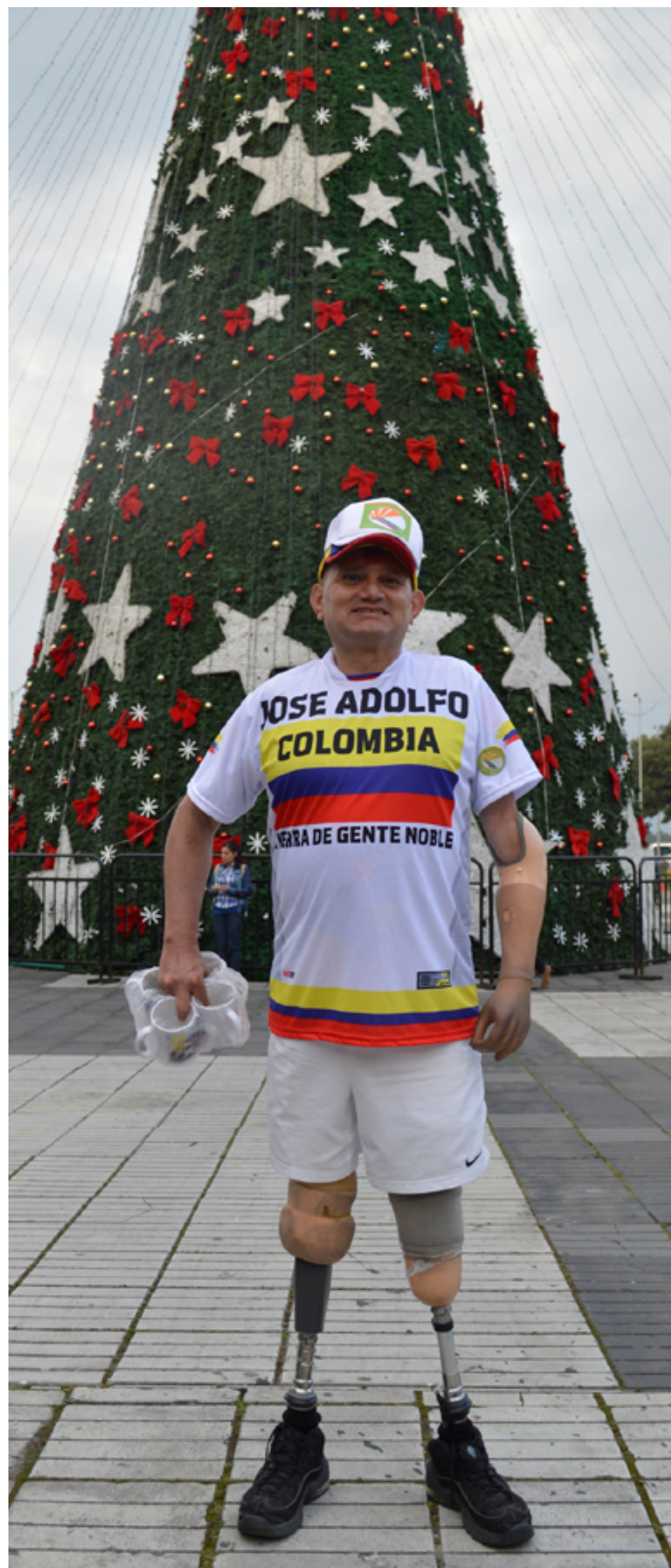
→ RECORTE DE Día Internacional de la Discapacidad (Participación Bogotá, 2016)

“La discapacidad es un concepto que evoluciona y que resulta de la interacción entre las personas con deficiencias y las barreras debidas a la actitud y al entorno que evitan su participación plena y efectiva en la sociedad, en igualdad de condiciones con las demás”, es decir, que no se mantiene estático, y depende de un contexto social, por cuanto la discapacidad es un concepto amplio y se integra con criterios tales como barreras actitudinales, comunicativas, físicas, sociales y ambientales, tanto así, que se habla que, para ser ubicado en esa población, no es cualquier deficiencia, sino aquella que sea física, mental, intelectual o sensorial a largo plazo” (CSJ 74579, 2021)