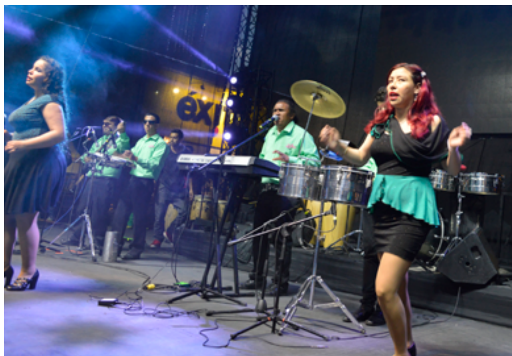
→ Día Internacional de la Discapacidad, (Participación Bogotá, 2016)

No obstante, los jueces han precisado que el escenario familiar puede ser vulnerador de los derechos de las personas en situación de discapacidad, especialmente por hechos de violencia intrafamiliar que en el caso de “las mujeres y las niñas con discapacidad suelen estar expuestas a un riesgo mayor de violencia, lesiones o abuso, abandono o trato negligente, malos tratos o explotación, dentro y fuera del hogar” (CC C-368 de 2014).